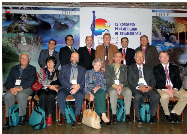
XVI Congreso Panamericano de Reumatología PANLAR 2010