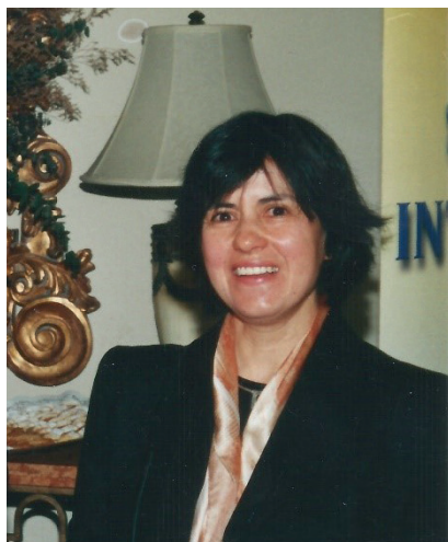
Dra. Loreto Massardo

Recibió el reconocimiento de numerosas sociedades científicas de diversos países, destacando en especial, su nombramiento de Master del American College of Rheumatology en el año 2002. A pesar de la seria y agobiante enfermedad que lo limitaba siguió trabajando y ayudando hasta el final de sus días. Fallece el año 2004.